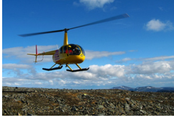
Figur 2: Ved bruk av helikopter og båt er det spesielt viktig med gode sikkerhetsrutiner. Fra kartlegging i Troms. Foto Anders Bryn, 2008.