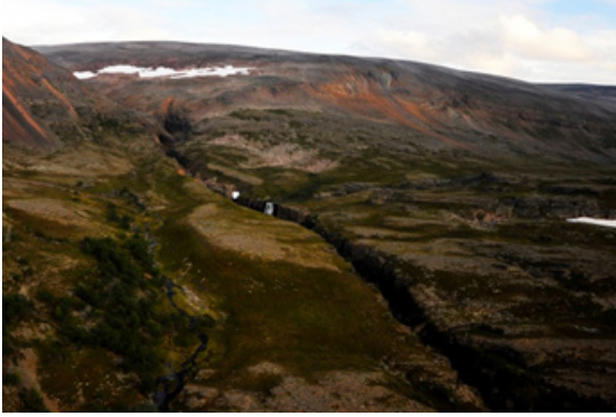
Figur 1: Gjøl, kløfter og andre landskapsbarrierer kan styre framdriften ved kartlegging. Fra kartlegging i Finnmark.